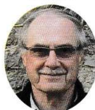
2 e adjoint