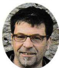
1 er adjoint