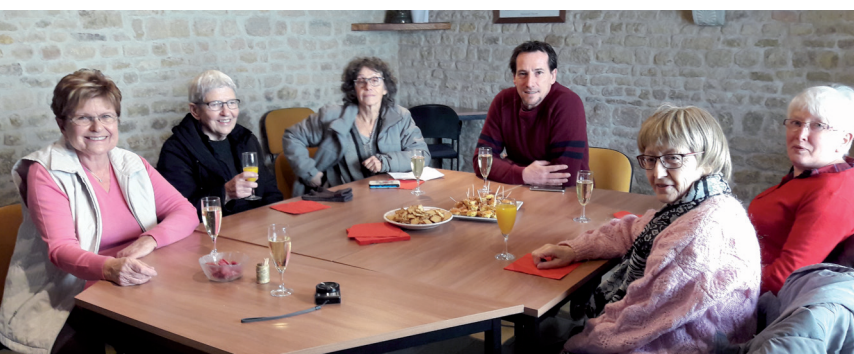
Un moment convivial avec quelques participantes à la formation pour un petit debriefing. Les retours sont positifs !

La municipalité a saisi l'opportunité de pouvoir disposer d'une subvention du Département de Charente-Maritime dans le cadre d'une opération à destination du public "personne âgée". Dix aînés ont suivi une formation personnalisée de 10 heures en janvier afin de découvrir et mieux maîtriser l'outil informatique, l'usage de l'internet et des réseaux sociaux. Le pari de la municipalité est de s'appuyer sur ces 10 personnes pour accompagner nos autres aînés à l'usage de l'informatique et de découvrir ainsi les différents services dans l'autre monde du numérique.