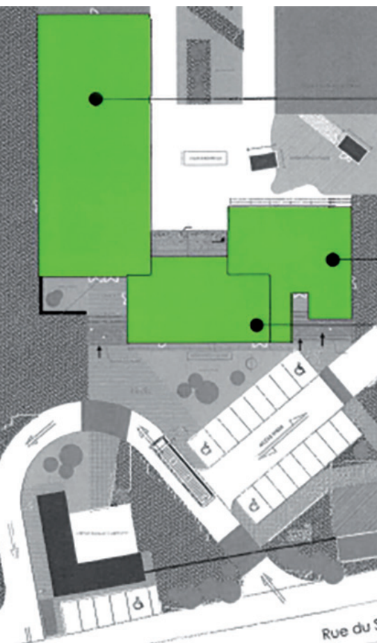
Esquisse qui a permis d'estimer la faisabilité du projet

L'année 2017 aura été celle des projets. En effet pour faire face à l'augmentation de notre population et à la saturation de nos équipements à destination de notre jeunesse, particulièrement la garderie (notre Accueil Collectif de Mineurs), la municipalité de Ballon, en étroite collaboration avec le RPI (Sivos de l'école du Marais) et la municipalité de Ciré d'Aunis, se sont engagés dans une réflexion et la réalisation d'une étude de faisabilité afin de répondre à cette problématique. Très rapidement et naturellement, des discussions ont été établies avec la Communauté de Communes Aunis Sud afin d'identifier des axes de mutualisation et de répartition des compétences intercommunales. Il en résulte plusieurs décisions qui vont permettre dès 2018 de rentrer dans une phase opérationnelle.